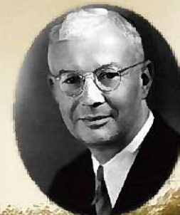
ウィリアム・マレル・ヴォーリス

ヴォーリス建築 再生プロジェクト 旧パーミリー邸 特別公開 10月31日(土)～11月1日(日) 10:00～17:00 会場/近江八幡市土田町819-7