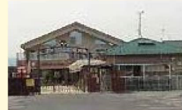
こだまふれんど保育園(約750m 徒歩10分)