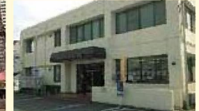
コミュニティセンター大宝(約900m 徒歩12分)

その他・大宝幼稚園(約900m 徒歩12分)・郵便局(約800m 徒歩10分) ※上記分数は乗車時間で、乗り換え、待ち時間はありません。※徒歩分数は80mを1分として計算した徒歩概測時間です。