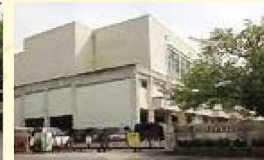
栗東西中学校(約400m 徒歩5分)