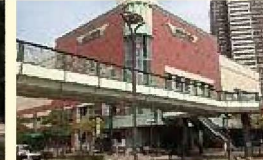
ウィングプラザ(約1,450m 徒歩18分)