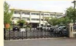
大宝小学校(約660m 徒歩9分)