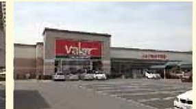
スーパーバロー(約800m 徒歩10分)